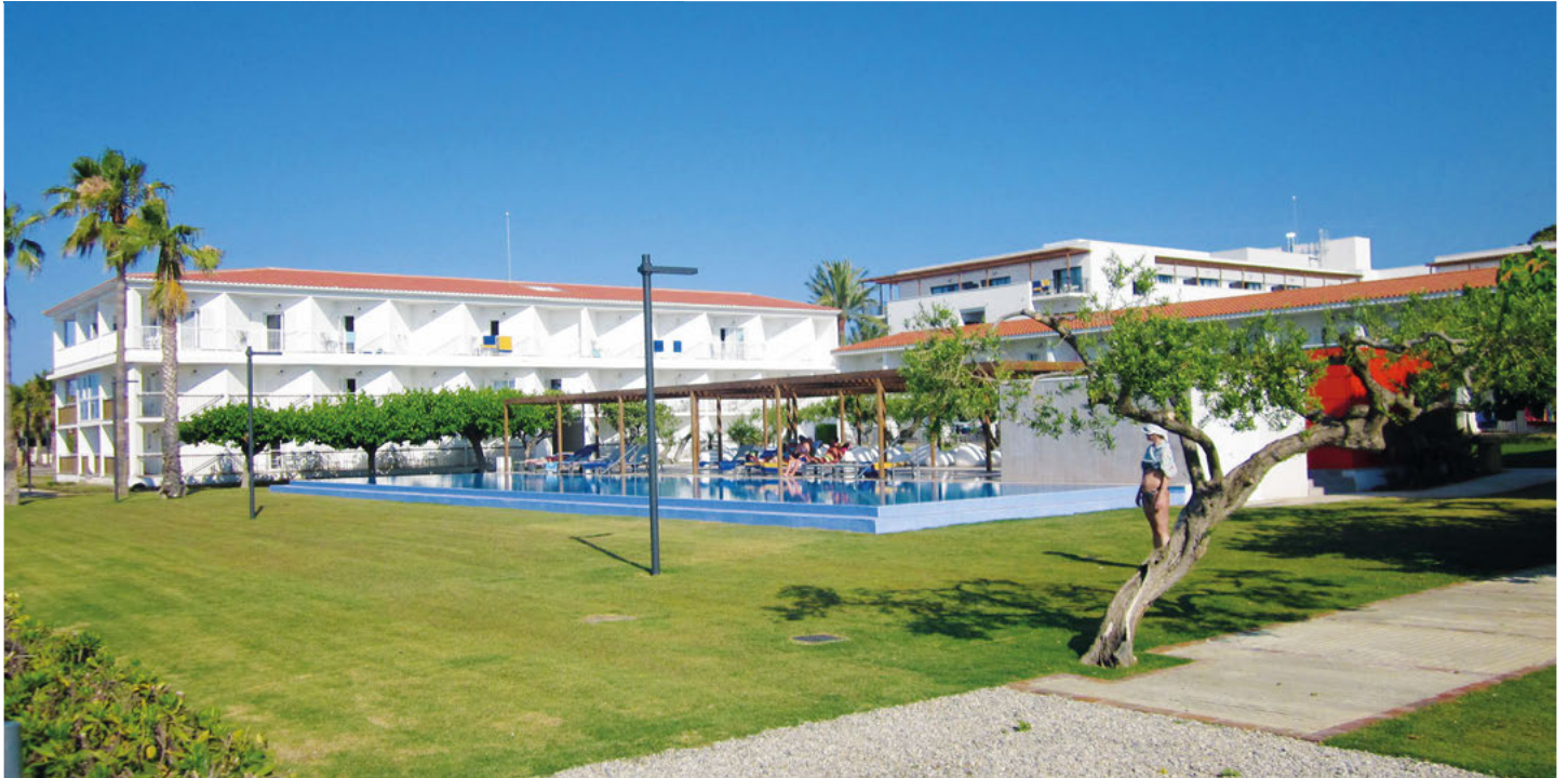
****Hotel Estival Eldorado Resort